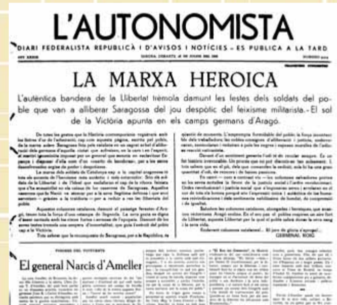
Una capçalera de ‘L’Autonomista’, en concret la que es va publicar el 28 de juliol del 1936