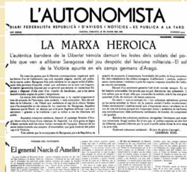
Una capçalera de ‘L’Autonomista’, en concret la que es va publicar el 28 de juliol del 1936