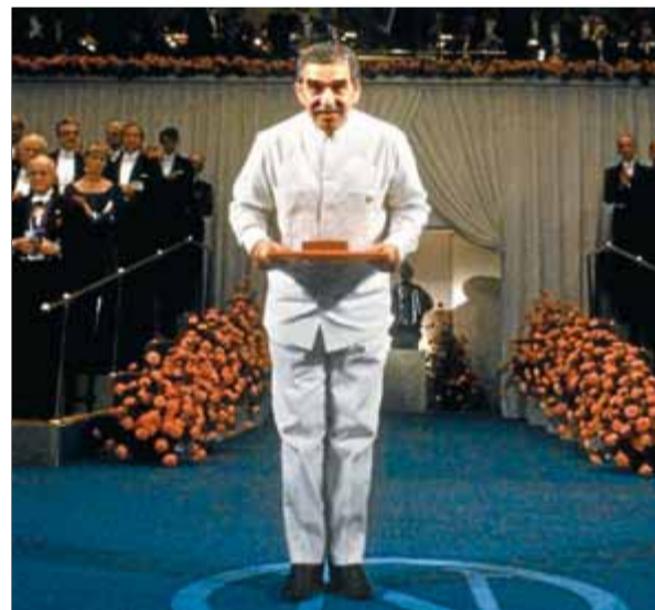
Gabriel García Márquez , amb el llibre 'Cien años de soledad'. Al costat, trasllat del furgó mortuori. A sota, saludant la multitud, i el moment en què va rebre el premi Nobel de Literatura

nel també el connectarien amb mons familiars i amb temes recurrents. Aquest personatge, segurament inspirat en el seu avi, protagonitzaria El coronel no tiene quien le escriba , una altra nouvelle imprescindible dins la bibliografia del colombià. La mort, els suïcides, l'espera i la denúncia són algunes de les constants d'un autor que sentia la fantasia com un component de la realitat, sense treure la vista dels seus companys eliminats o marginats. Personatge incòmode, se li va negar l'entrada als Estats Units –digui les