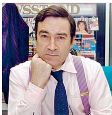
Pedro J. Ramírez, exdirector del diari madrileny 'El Mundo'

Pedro J. Ramírez, exdirector del diari El Mundo , ha reconegut en la tertúlia a RAC-1 que el seu diari no havia trobat cap indicati de delictes imputable al president de la Generalitat, Artur Mas. Ho va dir en una encesa discussió amb Pilar Rahola, parlant de la informació que va publicar el diari que dirigia, en plena campanya electoral catalana, i que acusava Mas de tenir comptes amagats a Suïssa. Rahola li exigia que demanés perdó i ell s'hi va negar. Però va dir: "No hem trobat cap indicati que ell participés expressament en cap delictes, en cap delictes que hagi prescrit."