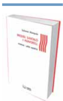
MIQUEL SANTALÓ I PARVORELL Salomó Marquès Editorial: Pagès Lleida, 2015 Pàgines: 160 Preu: 14 euros