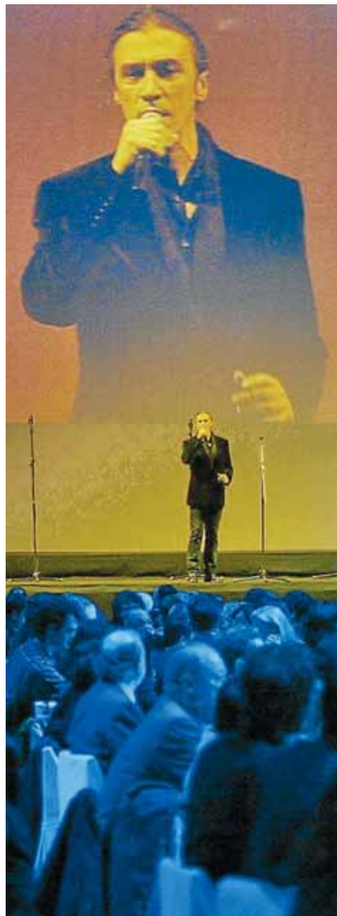
Una interpretació a piano del 2011; a sota, una imatge històrica de 1975, amb Ernest Lluch i Jordi Pujol; a la dreta, Gerard Quintana cantant durant la festa del 2006 a Girona

Llibreria Catalònia, va voler trencar la monotonia dels dos únics premis rellevants de l'època, el Ciutat de Barcelona i el Nadal, en tots dos casos per a obres en castellà. La intenció era recuperar l'esperit de les nits literàries que se celebraven en l'època de la República. Per tant, volia promocionar la llengua i la cultura catalanes a través de la literatura.