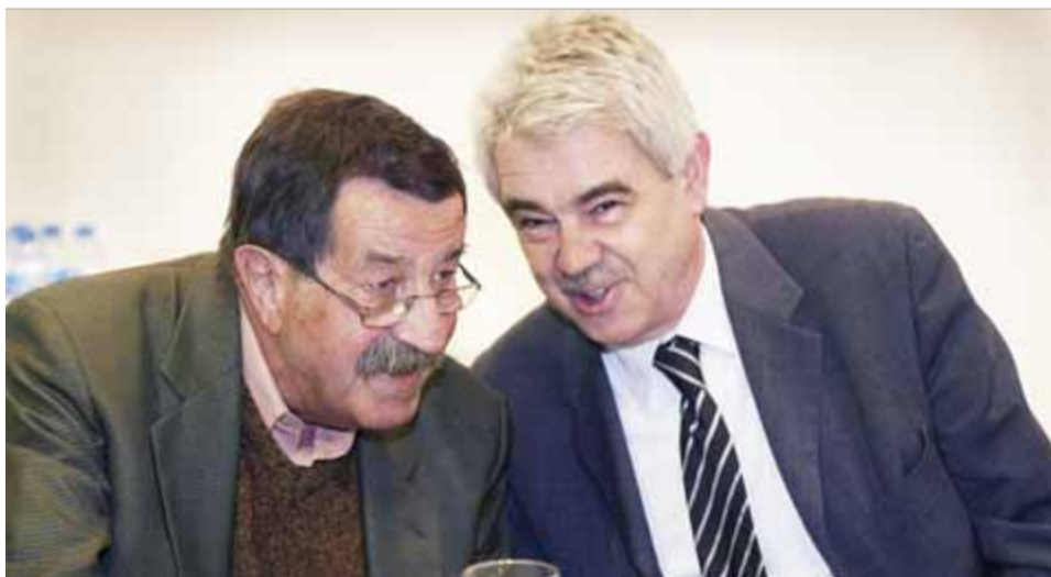
Günter Grass, en la seva visita a Barcelona el 2004. A dalt, a l'esquerra, al mercat d'antiquaris de la Catedral. A baix, amb el president Pasqual Maragall. A dalt, a l'esquerra, l'escriptor tocant un timbal de Ilauna a la seva ciutat natal, Gdansk, quan va celebrar 80 anys, l'any 2007

amb la seva Olivetti model Lettera a la qual es mantenia fidel, malgrat la irrupció dels ordinadors.