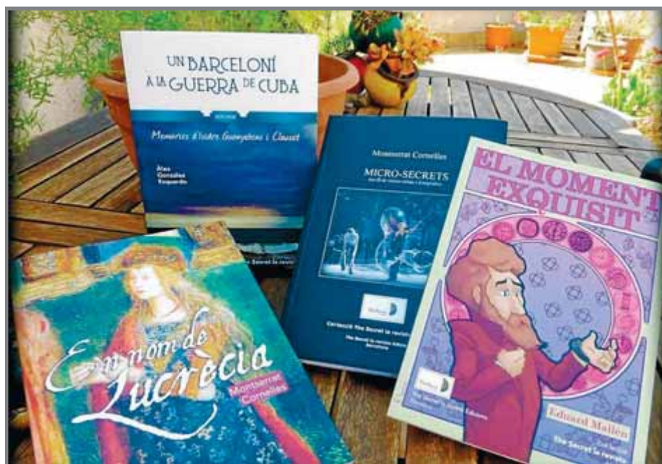
Els títols de 'The secret' alternen els diferents gèneres narratius