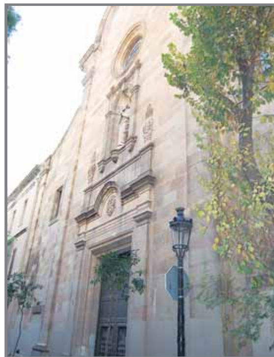
Alguns espais relacionats amb Maragall, i dues imatges de la seva casa i arxiu, al barri barceloní de Sarrià-Sant Gervasi L. SOLDEVILA