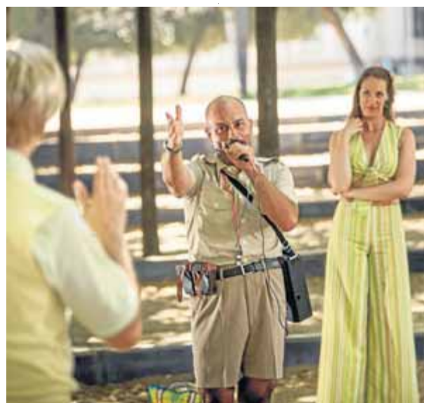
Un instant de l'assaig del muntatge, a l'espiral del parc del Nord

Hi ha instants per a la comèdia de traç gros, d'equívocs evidents que el públic espera, divertit, com la víctima caurà en l'engany. I de vestits i perruques estrafolaris. Però també alguna rèplica que apel·la a una certa denúncia o reflexió de major calat. Com quan Falstaff qüestio-