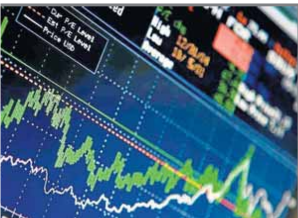
ropea té un dèficit energètic greu

Editorial: Poncianes Barcelona, 2016 Pàgines: 158 Preu: 18 euros