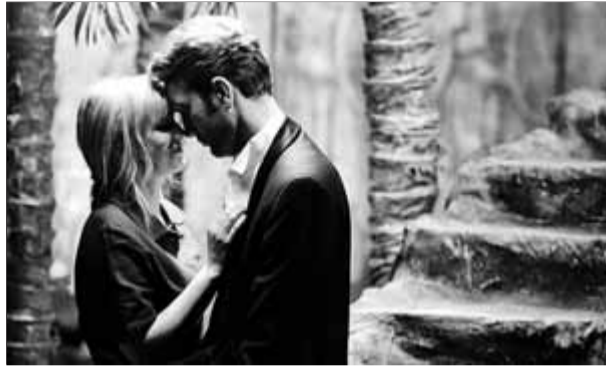
Joanna Kulig i Tomasz Kot a 'Cold War'

El cineasta polonès Pawel Pawlikowski va consagrar-se amb Ida , en què una jove catòlica, que vol ser monja, descobreix els seus orígens jueus i, després d'una intensa experiència amb la seva tia a la recerca de la memòria dels seus avantpassats víctimes de l'Holocaust viui una nit de disbauxa i amor amb un saxofonista abans d'entrar en un convent. En la nova pel·lícula de Pawlikowski, un músic, junt amb una dona que canta, i l'amor que comparteixen ocupen el centre d'un relat que, com apunta el títol, transcorre amb el transfons de la guerra freda. Un amor tan incontestable com impossible que no només s'enverina amb les circumstàncies de la seva