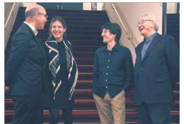
Els impulsors del Festival Clàssics a Barcelona, ahir al matí, al Teatre Romea

La producció, que farà temporada en breu al TNC, té temps per lligar millor els canvis d'escenes. Faria bé d'incidir en les projeccions d'aquesta línia clara traçada a l'infinit. Com un bon edifici futurista com el de Van der Rohe. La part interessant de la ciència-ficció no és crear robots i electrodomèstics que ho facin tot més fàcil, sinó tenir un punt de vista nou des d'on posar la lupa en el comportament humà d'avui. I aquí, Alba (o el jardí de les delícies) l'encerta plenament. I en això es reconeix la trajectòria de Molins i Artigau. ■