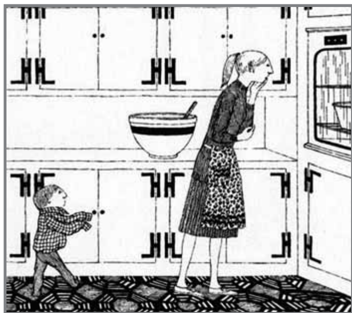
Gorey va il·lustrar l'obra combinant buit i atapeït / BLACKIE BOOKS

És un llibre dinàmic i atractiu gràcies al format ple de dibuixos i breus textos enquadrats, solapes, sobres, desplegable, manualitats... És molt accessible (en part gràcies a la traducció de Mònica Font) sense perdre un rigor que cal agrair. Només de llegir el llibre cap fill nostre es convertirà en una estrella, però les pistes que donen no són un simple joc. Una manera activa d'acumular un bon grapat de coneixements variats, des de com preparar targetes per als fans fins a com organitzar una exposició passant per una cosa que els nens i nenes actuals ja controlen de sèrie: com posar-se per a una fotografia. *