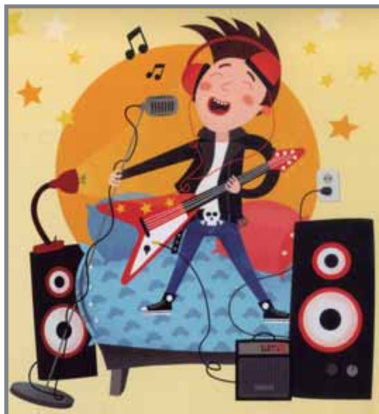
D'esquerra a dreta, il·lustracions de 'Sobre un raig de llum' (Vladimir Radunsky), 'Les idees de l'Ada' (Fiona Robinson) i 'Vull ser una estrella' (Diversos autors) / TAKATUKA / JOVENTUT / BAULA

de Berne i molt més detallat i ben aprofitat. Les il·lustracions, també de Robinson, utilitzen la tècnica del collage per mostrar amb perícia personatges, escenes, màquines i plantejaments matemàtics.