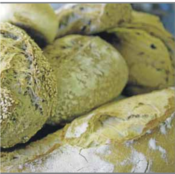
sos, suculentes / QUIM PUIG

reflexió – Contes per a un any no és, en cap cas, un llibre per ser engolit d'una tirada–, però n'hi ha una que és quintaessencial fins al punt de gosar recomanar que es comenci per Canta l'Epístola , se l'entengui i, després, es gaudeixi de la dimensió Pirandello en tot el seu gloriós esplendor. *