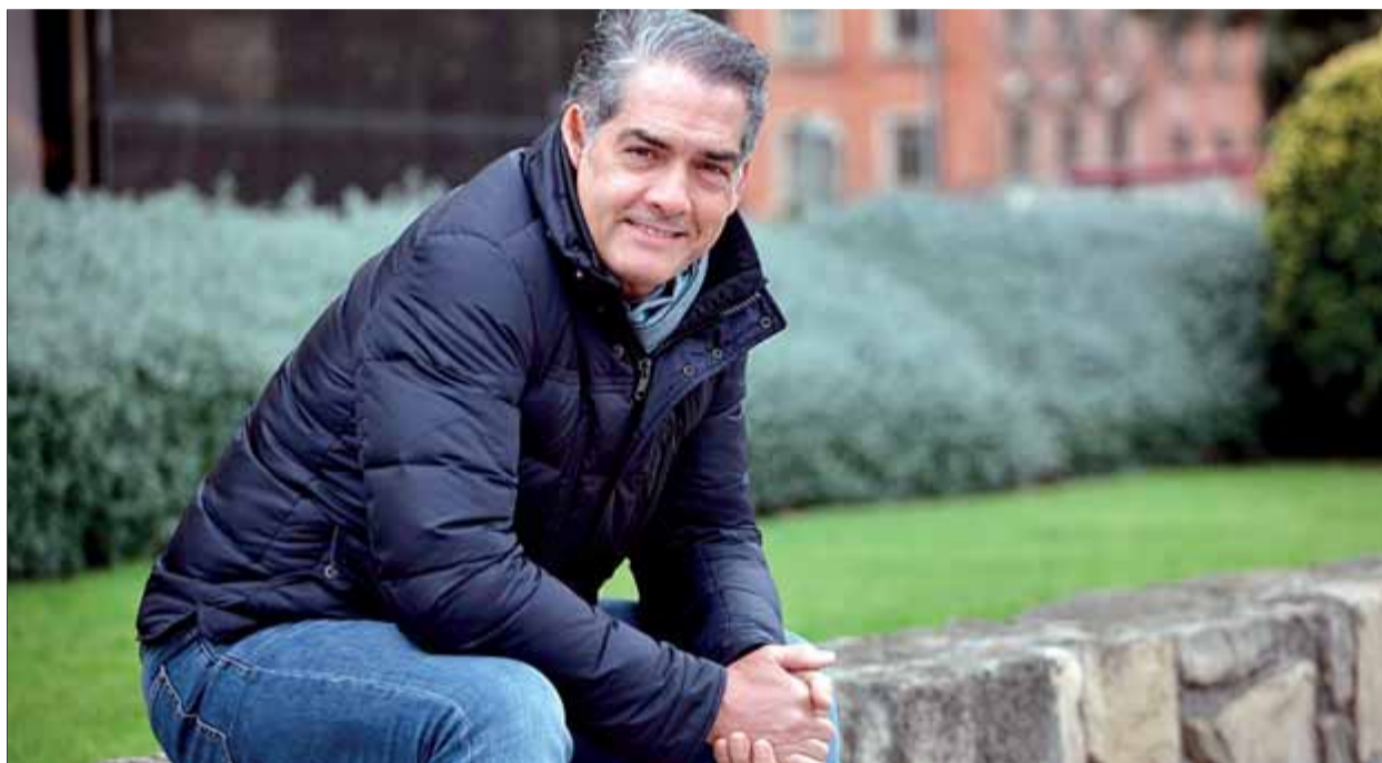
L'escriptor escocès Philip Kerr, en una imatge del 2015, quan va visitar Barcelona