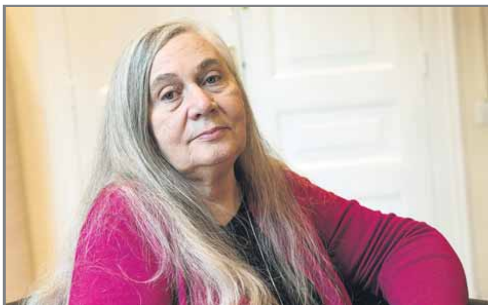
Marilynne Robinson, guanyadora del Pulitzer 2005 amb 'Gilead'

Editorial: Edicions 62 Barcelona, 2018 Pàgines: 280 Preu: 18,90 euros