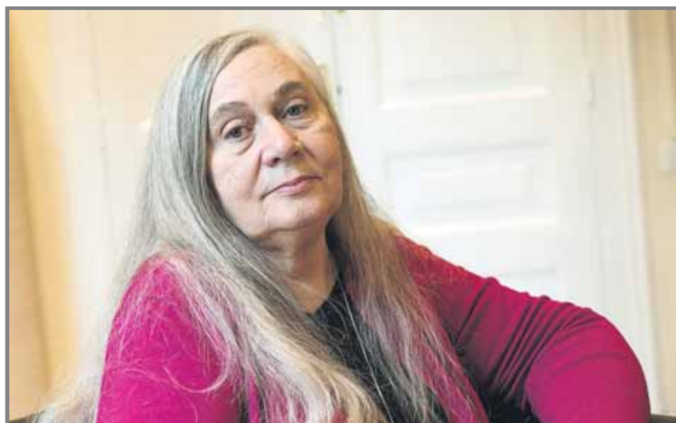
Marilynne Robinson , guanyadora del Pulitzer 2005 amb 'Gilead'

Editorial: Edicions 62 Barcelona, 2018 Pàgines: 280 Preu: 18,90 euros