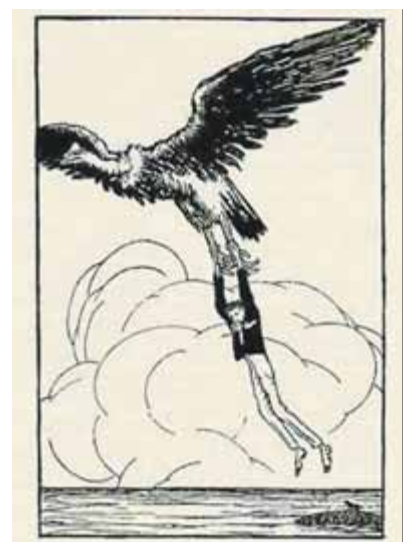
En Massagran en la versió de Junceda del 1910 per a Folch i Torres

Tant el dibuix com els guions s'inscriuen en la tradició de la línia clara europea: traç net i històries d'aventures exòtiques amb un cert enigma. Un altre dels elements que agafaria de la tradició europea