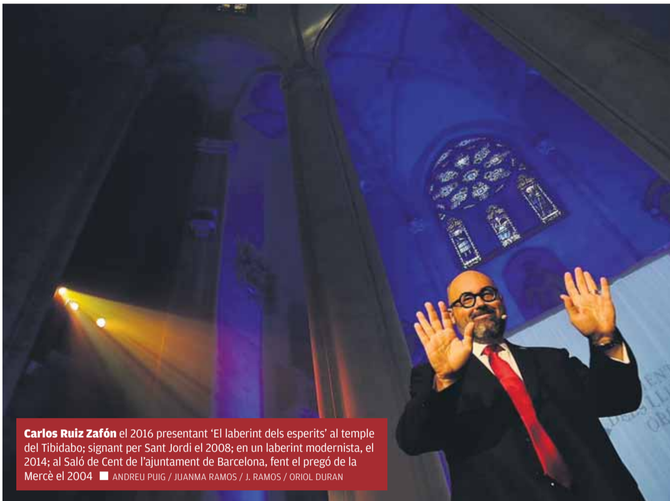
Carlos Ruiz Zafón el 2016 presentant 'El laberint dels esperits' al temple del Tibidabo; signant per Sant Jordi el 2008; en un laberint modernista, el 2014; al Saló de Cent de l'ajuntament de Barcelona, fent el pregó de la Mercè el 2004

Mor el creador de l'enigmàtic 'El Cementiri dels Llibres Oblidats'