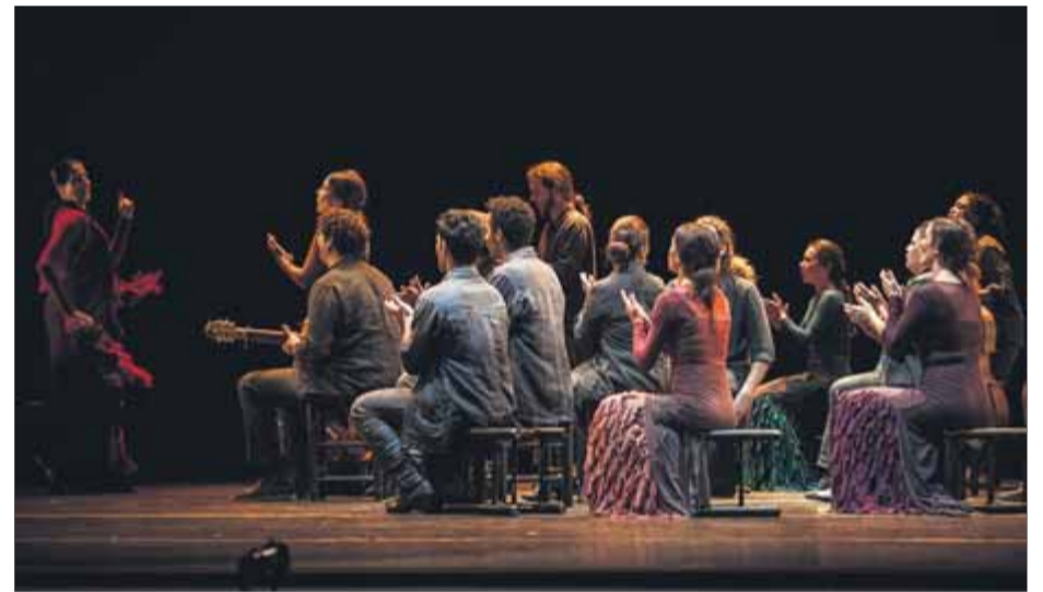
María Pagés en una actuació al Festival de Peralada