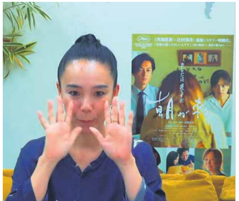
Naomi Kawase saluda des del Japó al final de la roda de premsa virtual

La pel·lícula adapta una novel·la de Mizuki Tsujimura publicada el 2015 que toca temes que li resulten propers: "El que em va agradar de la novel·la és