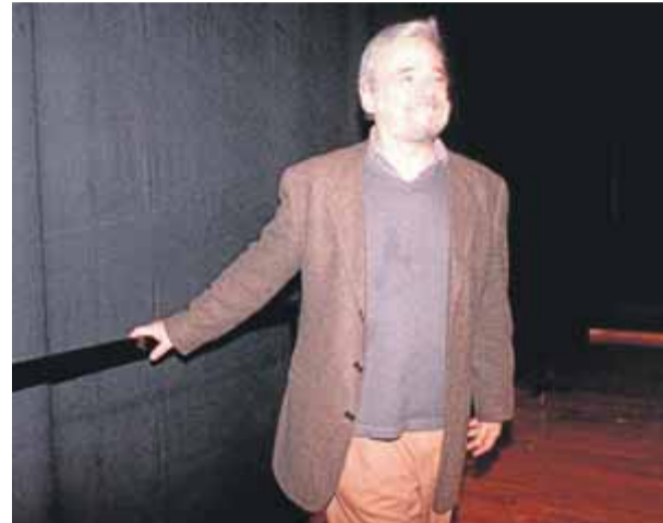
Stephen Sondheim a Barcelona fa vint anys