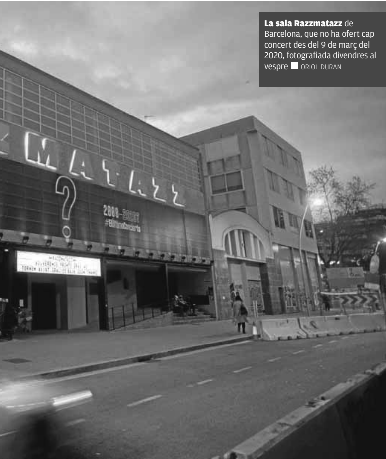
La sala Razzmatazz de Barcelona, que no ha ofert cap concert des del 9 de març del 2020, fotografiada divendres al vespre

sales que, d'altra banda, van agafar-se a les poques possibilitats de moviment que a partir del maig de l'anys passat va permetre el Procicat, hi ha el Sunset Jazz Club de Girona, que, junt amb el Jamboree de la plaça Reial de Barcelona, va oferir el 28 de maig el primer concert de la represa cultural a Catalunya. "Ho vam anunciar com el primer concert del món, però teníem clar que la notícia no era tant que una sala fes un concert sinó que la resta seguien tancades", explica Alix Levy, director artístic de la cava. Des de llavors, el Sunset, menys quan durant unes setmanes a la tardor es va impedir a les sales poder programar cap activitat, no ha deixat mai de fer concerts. "Hem reduït molt les actuacions", matisa, però, Levy. "Si