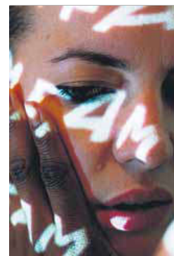
Un detall de 'FAM', de Les Impuxibles