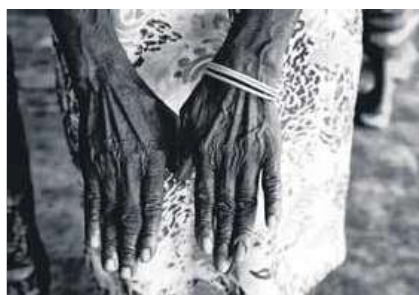
'Dale recuerdos', de Didier Ruiz ■ ARTURO BIBANG