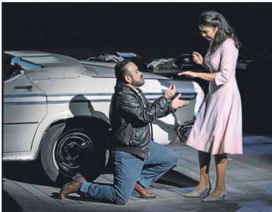
El tenor Javier Camarena i la soprano Nadine Sierra, en la 'Lucia di Lammermoor' que es pot veure fins al dia 28 al Gran Teatre del Liceu

Diríem que la possibilitat de gaudir d'un dels duos més importants dels que poden escoltar-se en el panorama operístic mundial: la soprano nord-