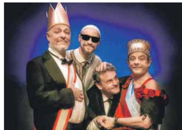
Una foto promocional del muntatge