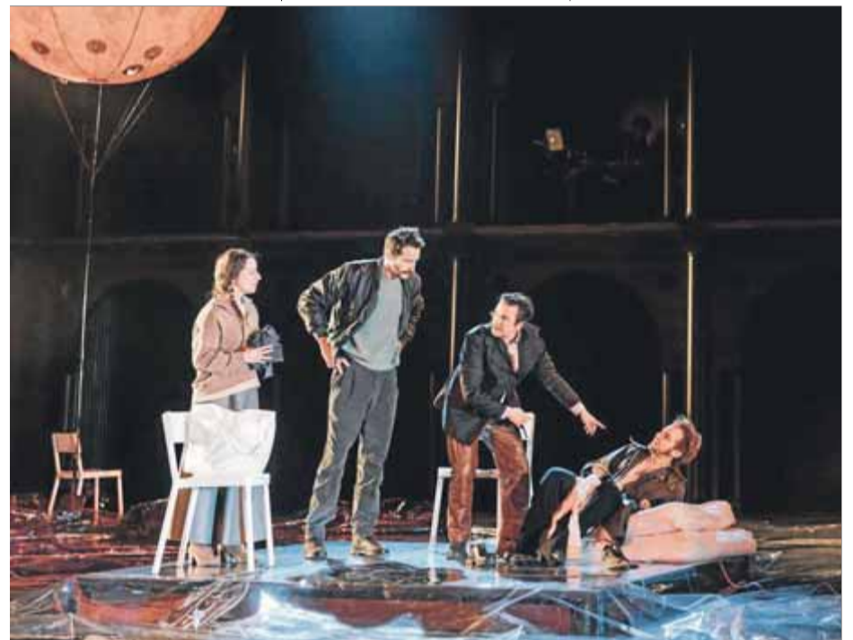
Batalla, Prat, Guinart i López a 'Crim i càstig', al Teatre Lliure ■ SÍLVIA POCH