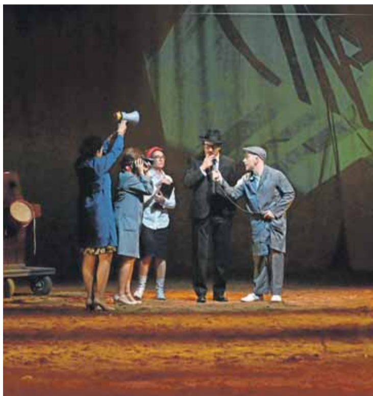
Un detall del muntatge '28 i mig' que es va veure dilluns i ahir a l'Amfiteatre Grec

L'Oriol Broggi, amant de la buidor i de l'austeritat que cantava Peter Brook per narrar amb nitidesa un conte ( L'orfe del clan dels Zhao ) i deixar que la imaginació voli, s'ha deixat anar per l'acumulació de capes, per atrapar des de l'acumulació: no tenir mai prou per mostrar una imatge encara més emocional, precisa, preciosa, amb un to aparentment espontani, mediterrani, de cantarella napolitana, de tòpics de mossens pederastes, dones que guarden ocells als sostenidors ( Giornata particolare ) i d'un humor farsesc que topa, de sobte, amb la crueltat de les botes nazis. Abans dels estudis de Cinemàtica, la cultura era autòctona, de companyia de teatre ambulànt (com els d'Eduardo de Filippo, Natale in Casa Cuppielo ), o potser els d'un cert humor de boulevard ( Filumena Marturano ).