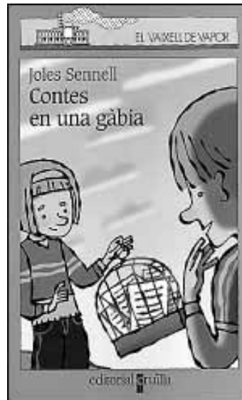
Joles Sennell, Contes en una gàbia . Il·lustracions de Pep Montserrat. Col·lecció El Vaixell de Vapor . Editorial Cruïlla. A partir de 7 anys.