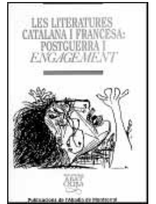
Diversos autors, Les literatures catalana i francesa: postguerra I. 'Engagement' . Publicacions de l'Abadia de Montserrat. Montcada i Reixac, 2000.

M itologia de la mar i Diccionari d'endevinalles , són els dos primers llibres de la nova Biblioteca de Tradicions Populars que recupera la col·lecció de butxaca més popular sobre monografies del folklore en facsímil de Joan Amades i comentades per especialistes en cada tema.