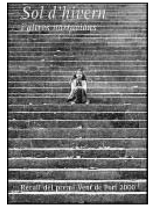
Diversos autors, Sol d'hivern i altres narracions . Recull del premi Vent de Port 2000. Proa. Barcelona, 2000.

N ova traducció d'unes de les narracions de l'autor de clàssics com ara Oliver Twist , David Copperfield i Grans esperances , entre d'altres. Un conte en què el vell Scrooge fa un viatge al passat i al futur de la mà de la mort. Un retrat social carregat d'ironia.