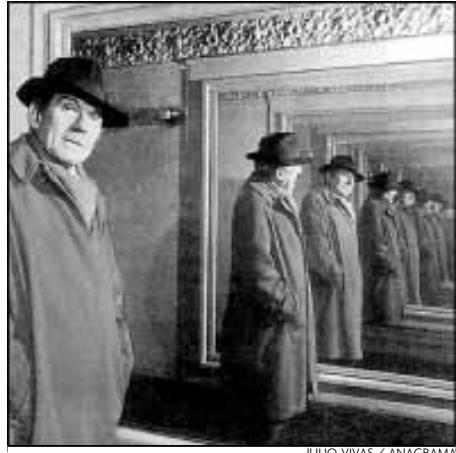
El pensador Gilles Deleuze

Segons això, el primer que compta és la llibertat, no restringida per cap imperatiu, ja sigui categòric o no gens kan-