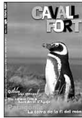
Cavall Fort. Número 925. Cavall Fort S.L. Barcelona, febrer, 2001.