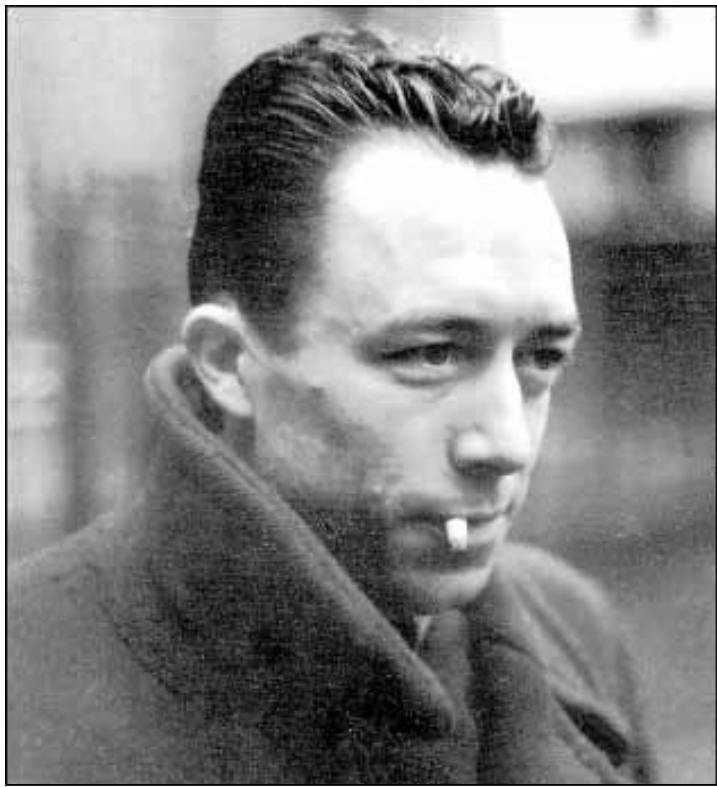
El francès Albert Camus, autor de 'L'estrany'