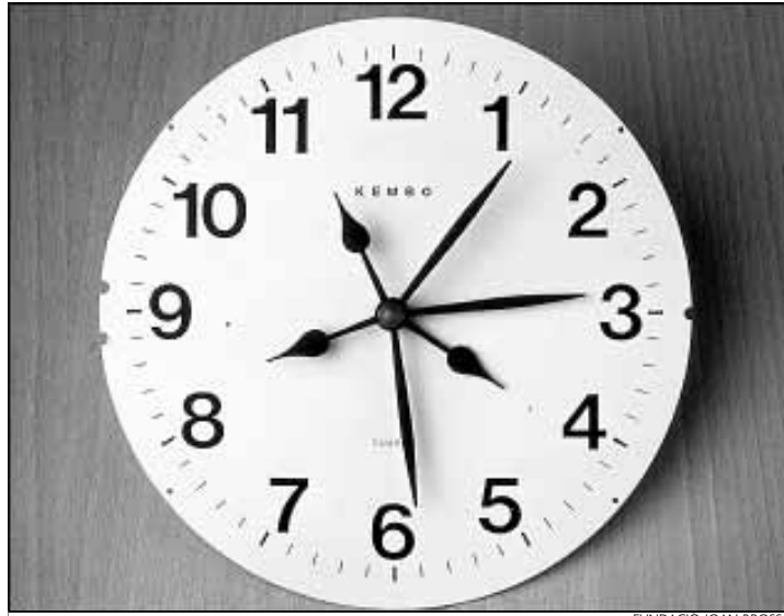
'Kembo', obra del 1988

En tota l'obra de Brossa és present l'esperit de revolta social i política. El seu compromís ètic i estètic amb la llibertat individual i col·lectiva, amb la justícia social, és rotund i indiscutible. Potser és en alguns dels seus poemes visuals i en alguns dels seus darrers objectes o de les seves últimes instal·lacions que és més contundent el seu missatge alliberador. Així, per exemple, la instal·lació El convidat (1989), on al costat d'un garrot vil, com els que s'utilitzaven per executar els condemnats a mort fins fa encara pocs anys a Espanya, contemplem una taula parada amb unes estovalles immaculades i una vaixel·la de luxe, com si estigués preparada per al darrer àpat abans de la mort. L'herència de l'humor negre del surrealisme i del dadaisme és ben present en l'obra de Brossa, en la poesia i l'art més crític del nostre temps. És difícil pensar