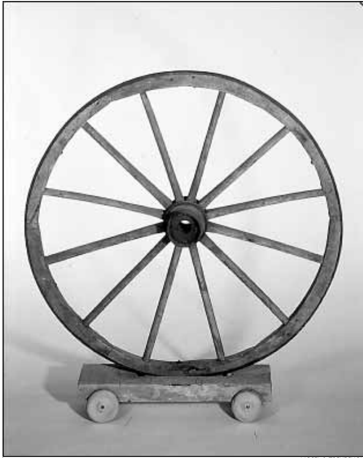
'Roda', obra del 1986

6. Les imatges en moviment. El cinema. Conseqüent amb l'esperit de la modernitat i de l'avantguarda que sempre l'inspirà, Brossa considerarà el cinema com l'art del segle XX per excel·lència. S'interessà vivament pel llenguatge cinematogràfic i el fascinaren sempre les imatges en moviment dels aparells del precinema. L'afició pel llenguatge del cinema i pels seus mites és evident en l'obra poètica de Brossa. Gran coneixedor de la història del cinema i espectador d'excepció, com a guionista tingué dues èpoques de màxima activitat. La primera, al voltant de Dau al Set , quan escrivé els guions Foc al càntir (1948) –recentment convertit en film per Frederic Amat– i Gart