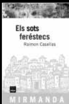
Els sots feréstecs Raimon Casellas Col. Mirmanda, 8

En un viatge per la història, l'autor ens explica els prodigis, alguns desconeguts, de la muntanya de Montserrat.