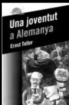
Una joventut a Alemanya Ernst Toller. Soldats de ploma , 7