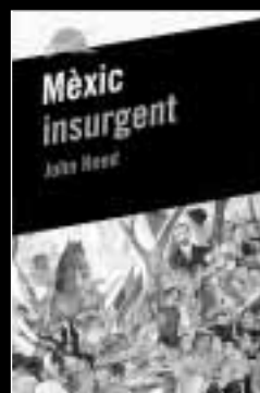
Mèxic insurgent John Reed Soldats de ploma , 8

Autobiografia de l'escriptor expressionista Ernst Toller. Relat de l'època que precedeix la Primera Guerra Mundial i els fets revolucionaris posteriors. Una obra decisiva per a comprendre l'ascens del nazisme.