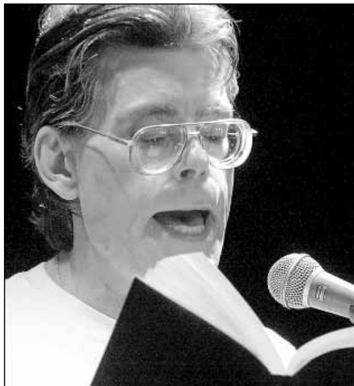
Stephen King ha publicat un relat exclusivament a Internet