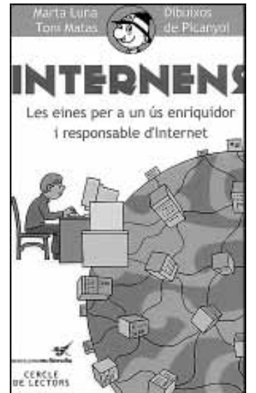
Marta Luna i Toni Matas, Internens . Il·lustracions de Picanyol. Barcelona Multimèdia i Cercle de Lectors. Barcelona, 2002. A partir de 7 anys.

Els avis dels protagonistes d'aquest conte planegen unes vacances en alta mar amb els néts i un grup d'amics, però una tempesta els arrossega cap a una illa molt especial. En un paratge insòlit on sempre és de dia i de nit a la vegada, s'endinsen en una aventura plena de fantasia que no oblidaran mai més.