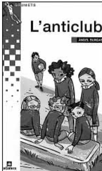
Àngel Burgas, L'anticlub . Il·lustracions d'Ignasi Blanch. Col·lecció Grumets . Editorial La Galera. Barcelona, 2002. A partir de 12 anys.

D'altra banda, l'àlbum del premi Apel·les Mestres, pel que fa al text, és un cant a la necessitat de compartir, a partir dels ulls de la protagonista que aprèn a veure les coses que més estima i a apreciar-les per no viure en l'egoisme d'aprofitar-se'n ella sola. L'il·lustrador Jordi Sàbat ha optat per un treball que transporta a una mena de bagul de joguines. El cavall de cartró, les bitlles, els soldats de plom, el cotxe de curses i alguna altra, joguina pròpia dels encants introdueixen la imatge frontal de la protagonista que assalta el visitant de l'àlbum amb una làmina que recorda un dels retrats de la primera etapa de Joan Miró. La resta és un recorregut minuciós per les peces del bagul fins a deixar-lo buit.