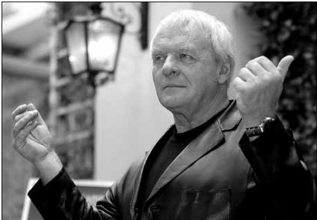
Anthony Hopkins era Frank Doel en la versió cinematogràfica de '84, Charing Cross Road'

L a lectora desacomplexada va anar acumulant llibres fins que un dia va haver de triar: o s'hipotecava fins a l'eternitat per comprar un pis amb més metres quadrats, o es desfeia dels volums que no pensava llegir ni rellegir mai. Va guanyar la segona opció, per raons de pressupost. Ara, després de llegir un llibre, l'ordena a la prestatgeria (si li ha fet el pes) o el guarda a la pila de llibres per regalar (si no té cap intenció de tornar-lo a llegir ni fullejar en els pròxims cinquanta anys).