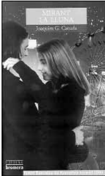
Joaquim G. Caturla, Mirant la lluna . Col·lecció Espurna . Edicions Bromera. Alzira, 2001. A partir de 14 anys.

En definitiva, l'àlbum Un somni redó recull el concepte de retorn als valors universals, expressat en el text precís d'aquesta narració circular i amb unes il·lustracions molt treballades de fons i de factura excel·lent, cosa que fa que sigui recomanable per a tots els públics sensibles.