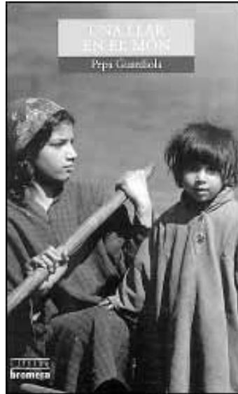
Pepa Guardiola, Una llar en el món . Col·lecció Espurna . Edicions Bromera. Alzira, 2001. A partir de 14 anys.