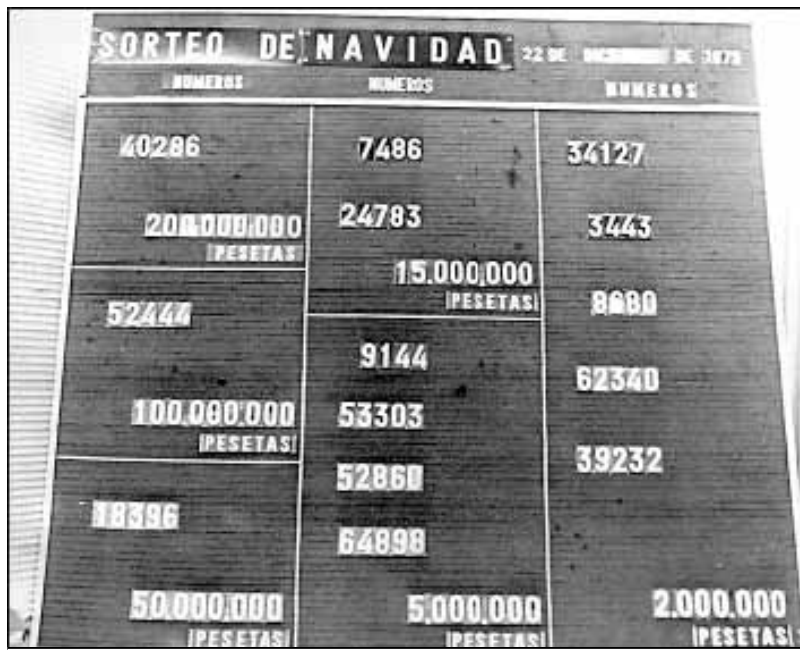
En literatura, com en la loteria, també hi ha la teoria del capicua

I ara que m'hi fixo, les bones novel·les passen la prova del capicua per la mateixa raó que els vells la passem, oi? Que duri.