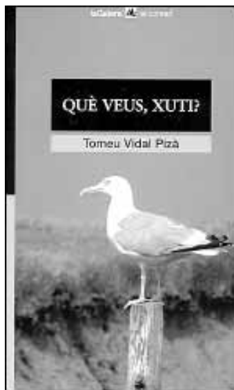
Tomeu Vidal Pizà, Què veus, Xuti? Col·lecció El Corsari . La Galera. Barcelona, 2001. A partir de 14 anys.

A Muntar-s'ho , s'hi troba l'acceptació de la pròpia realitat, positivament-la. En canvi, a la narració epistolar Qui juga amb foc... , la protagonista se sent culpable de l'enfonsament d'un home quan ella el va refusar. Tanca el recull Una mena de fracàs , retrat realista de la superficialitat del món de l'edició: presentació, canapès, signatura de llibres... De la faramella circumdant, l'autor enfoca amb tendresa un jubilat que no té diners per comprar-se el llibre.