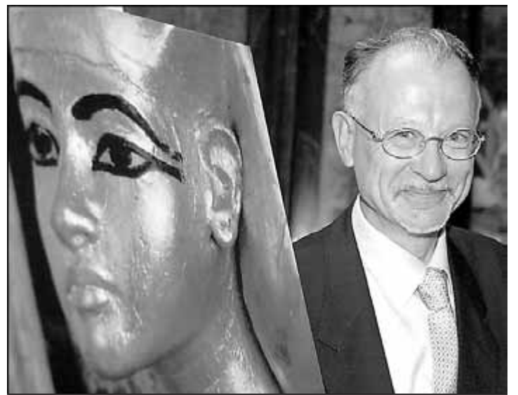
L'EGIPTÒLEG FRANCÈS CHRISTIAN JACQ

L'últim volum de la trilogia La Reina Llibertat , que compta amb poc més de 300 pàgines i està dividit en 61 petits capítols, permet seguir les vicissituds d'Ahhotep, de la seva mare, la reina Tetisheru -Teti la Petita-, de l'emperador Amosis i dels guerrers l'Afganès i el Bogotut, mentre que del bàndol dels hiksés permet apropar-nos a l'emperador Apopis, el gran tesorero Khamudi i l'almirall Janàs, que s'enfrontaran en una lluita sense quarter pel poder. En el llibre es relata el cruel i sanguinari règim dels hiksés i la duresa amb què Apopis, Khamudi i Janàs exercien el seu poder. L'espasa flamejant està ple d'assassinats, de purgues, d'intrigues, de complots. A més, conté al final una inesperada sorpresa de traïció en les files de la reina Ahhotep.