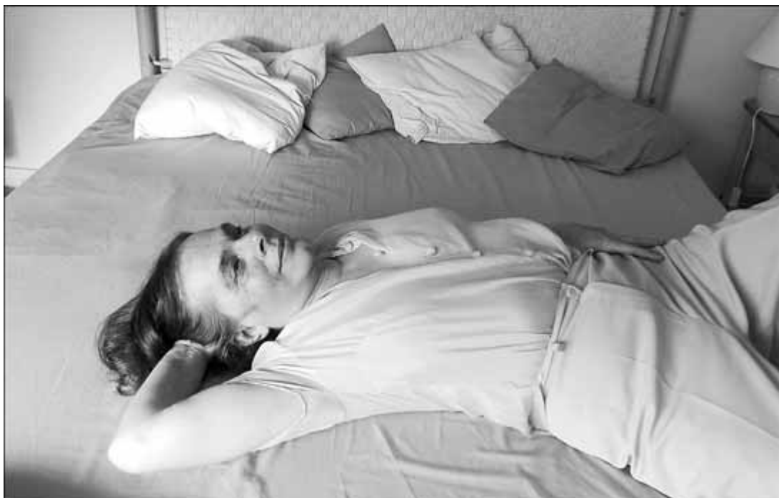
LA POETA I NARRADORA CRISTINA PERI ROSSI