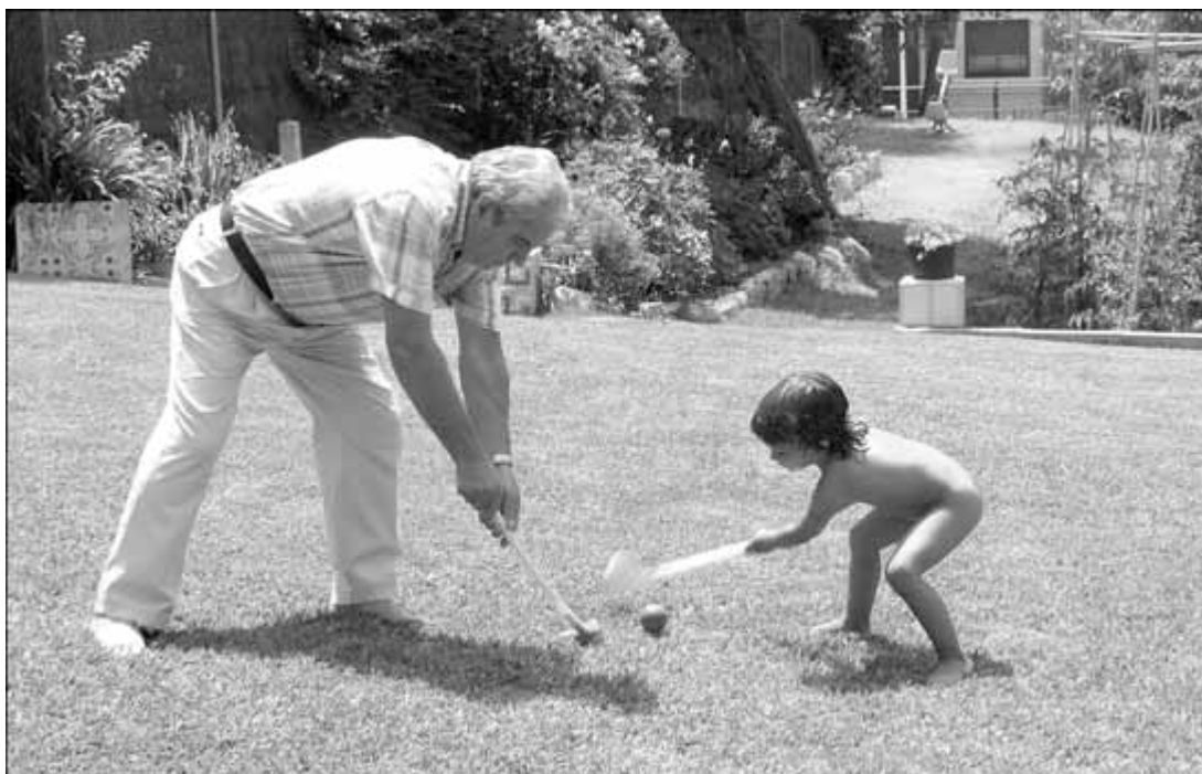
EL NOVEL·LISTA JOAN MARSÉ AMB EL SEU NÉT A CALAFELL