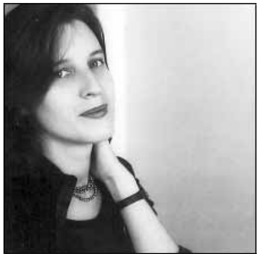
Chloe Hooper va néixer a Melbourne el 1973

Aquestes línies han volgut fer coincidir en un únic espai literatura australiana i literatura sobre Austràlia escrita per autors d'arreu del món. Un món que redefineix etiquetes,