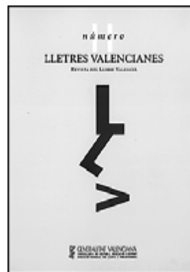
Lletres Valencianes. Número 11. GENERALITAT VALENCIANA. València, tardor, 2003.

Aquesta revista d'arquitectura està dedicada en aquesta ocasió a les transformacions urbanes que es produeixen a Barcelona i la seva àrea metropolitana amb motiu de la celebració del Fòrum de les Cultures.