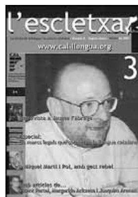
L'Escletxa. Número 3. FUNDACIÓ REEIXIDA. BARCELONA, GENER, 2004.