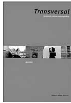
Transversal. Número 22. AJUNTAMENT DE LLEIDA. Lleida, gener, 2004.