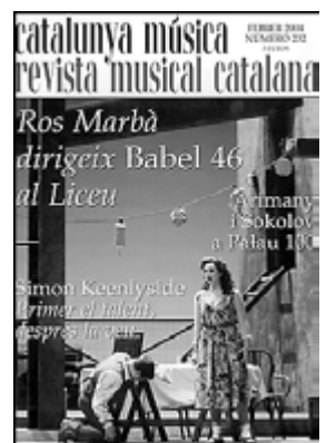
Catalunya Música. Número 232. FUNDACIÓ PALAU DE LA MÚSICA. Barcelona, febrer, 2004.