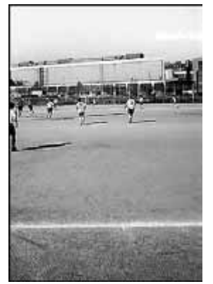
Quaderns. Número 240. COL·LEGI D'ARQUITECTES DE CATALUNYA. Barcelona, febrer, 2004.