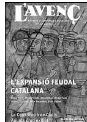
L'Avenc. Número 290. L'AVENÇ SL. Barcelona, abril, 2004.

Després de mesos d'anunciar-ho, la revista Cavall Fort ha arribat al número 1.000 en la segona quinzena de març. Felicitats! Per celebrar-ho la qualitat del paper d'aquesta edició és superior a l'habitual i han arribat a les 68 pàgines en què es resol el cas del segrest del timbaler, símbol de la revista creat per Cesc.