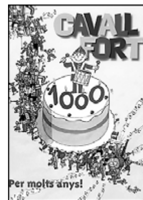
Cavall Fort. Número 1.000. CAVALL FORT SL. Barcelona, març, 2004.

Després de mesos d'anunciar-ho, la revista Cavall Fort ha arribat al número 1.000 en la segona quinzena de març. Felicitats! Per celebrar-ho la qualitat del paper d'aquesta edició és superior a l'habitual i han arribat a les 68 pàgines en què es resol el cas del segrest del timbaler, símbol de la revista creat per Cesc.