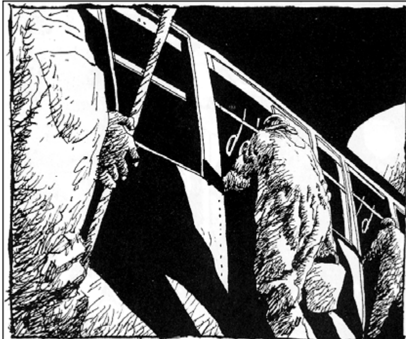
UNA VINYETA DE 'RECUERDOS DE UN DETECTIVE PRIVADO'

el temps no hagi passat per aquelles primeres historietes d'Alack Sinner, la mateixa confusa reedició dels tres primers llibres, que barreja diferents etapes estilístiques i fins i tot narratives, resalta el molt positiu valor afegit de l'evolució. Així, després d'una narració posterior que exerceix de pròleg explicatiu dels orígens del nostre protagonista, ens trobem amb les primeres narracions, molt lligades al gènere negre de Chandler i MacDonald i a un tractament del blanc i negre força expressiu però encara contingut. A poc a poc, la narració s'alliberarà dels codis de la intriga per dedicar-se a descriure situacions més o menys arquetípiques dels EUA. El desordre que s'introduirà tant en el temps dels relats com en el del grafisme, produirà moments carregats de força dramàtica, intenses situacions i interessants personatges que s'expressaran en esplèndides vinyetes, que amb el seu barroquisme faran de miralls impossibles del malson nord-americà.