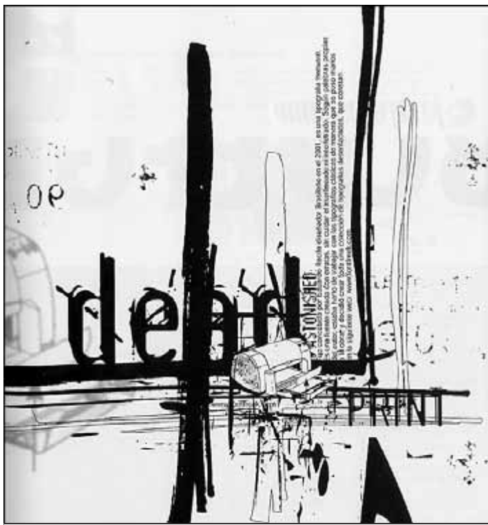
A 'BLACK TIPOGRÁFICO' FAN EXPERIMENTS AMB L'ALFABET